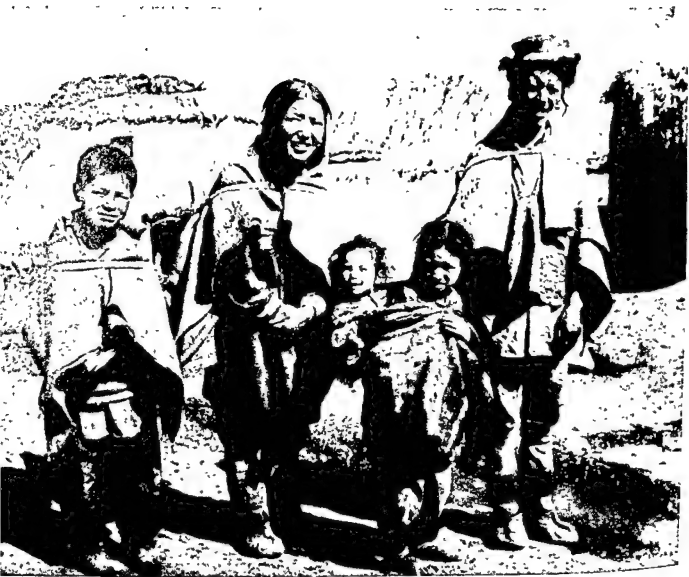
साहील स्थिति के यायावर